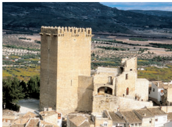
La Torre del Homenaje del castillo de Moratalla es ejemplo de la arquitectura militar medieval.